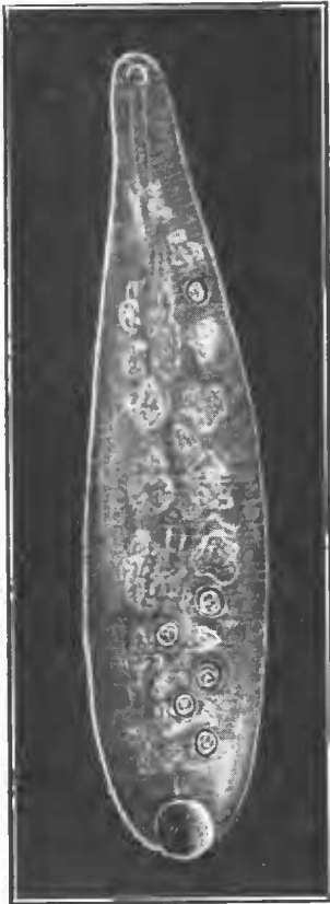
Fig. 3. Haementeria sp., avec six métacercaires enkystés.

Toutefois les caractères suivants nous paraissent suffisants pour définir une nouvelle espèce. Le corps blanc laiteux est absolument dépourvu de papilles et de toute ornementation segmentaire. Le plus grand des individus atteint 10 mm. de longueur sur 3 mm. de plus grande largeur. Le plus petit individu ne mesure que 6 mm. Il y a de 60 à 63 anneaux dont deux anneaux précoculaires. Le premier orifice génital est situé entre les 33 e et 34 e anneaux; le deuxième est séparé du premier par 3 anneaux. Le tube digestif offre un dessin caractéristique: il y a d'abord six paires de caecums latéraux présentant en général quatre petits lobes supérieurs; il y a, en outre, deux caecums postérieurs présentant au moins trois grandes ramifications du côté externe. La ventouse postérieure, relativement grande (1 mm.), a un bord légèrement festonné.